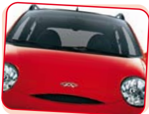
Mignonne à croquer